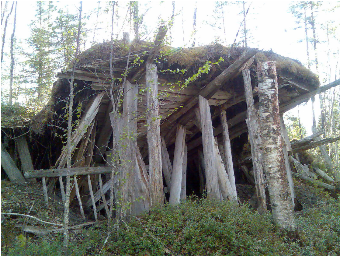
Tjärdal vid Bjursele, Vindelns kommun. Delen där tjäran skulle rinna ut var uppbyggd av stockar och brädor.

Tjärdalar grävdes oftast in i en sluttning som gav en naturlig lutning och ett utlopp för tjäran. I vårt skogrika län fanns goda förutsättningar för att framställa tjära, och tjärdalar är en vanlig typ av lämning. De flesta anlades troligen under 1500-talet och framåt, en period då tjära var en stor exportvara. Under delar av 1800-talet var Västerbotten den största tjärproducenten i landet. Sökord Kemisk industri.