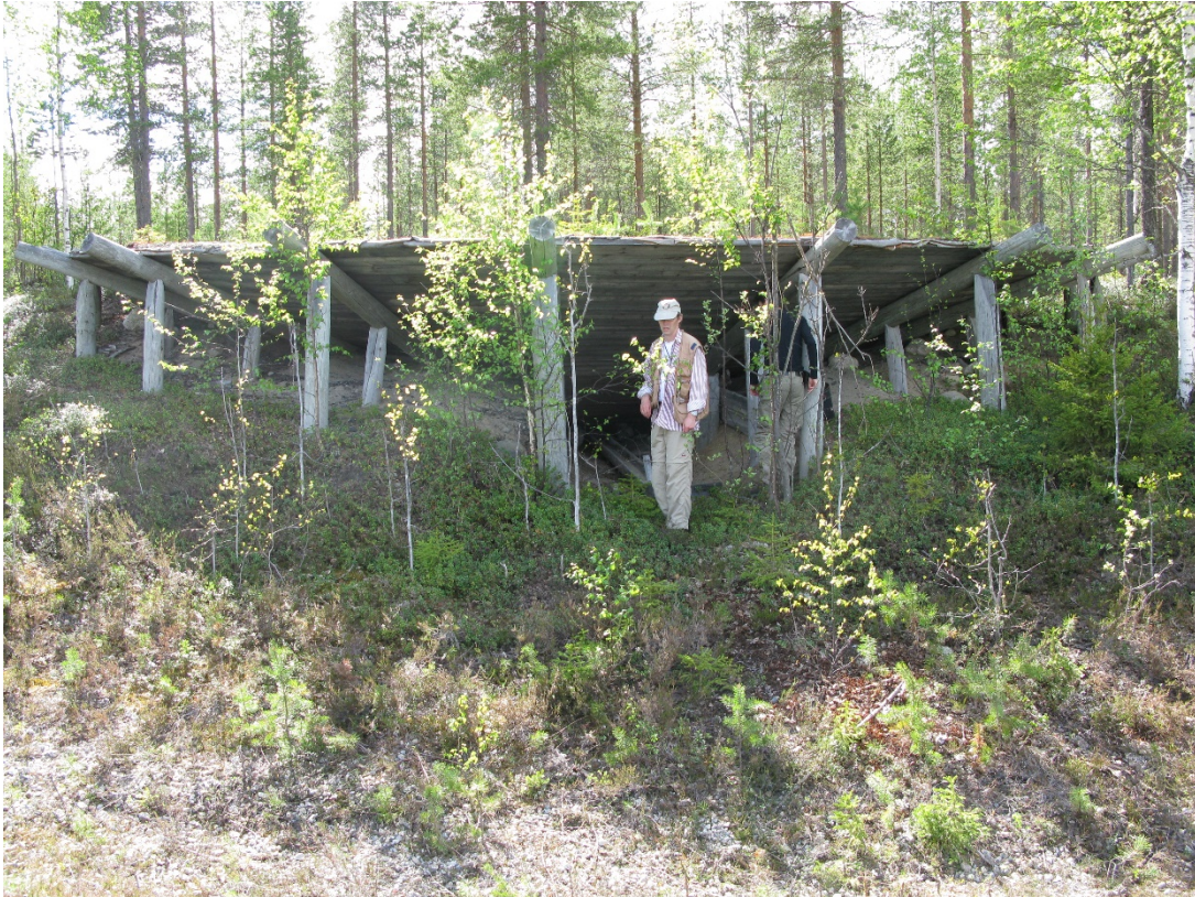
Nybyggd tjärdal i Arvsele, Vindelns kommun.