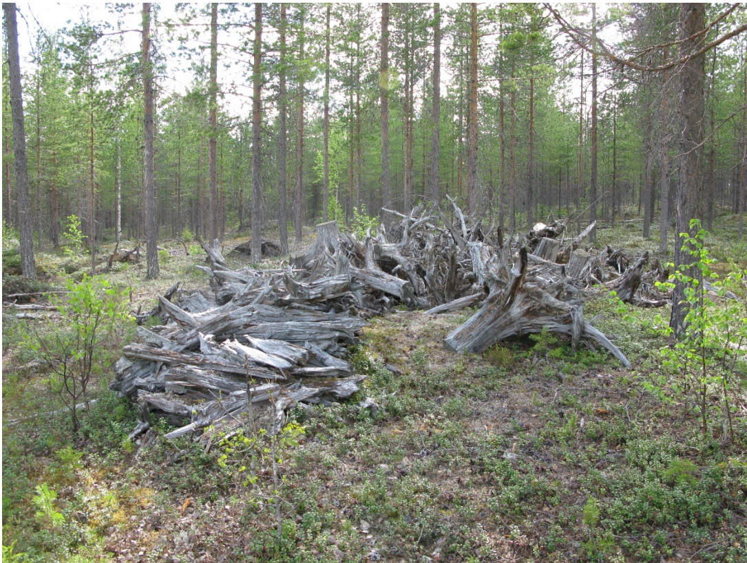
För att bränna en tjärdal behövdes en stor mängd tjärstubb som skulle klyvas till småved.