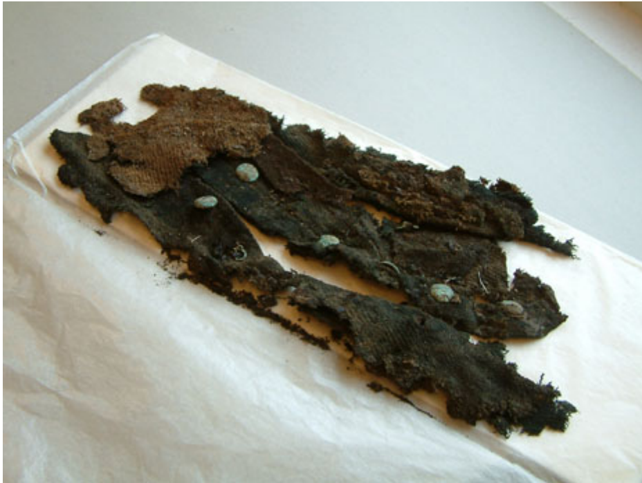
Rester av väst med knappar från Gamplatsen.

De äldsta textilföremålen i Västerbottens museums arkeologiska samlingar kommer från 16- och 1700 tal. Det är bland annat en del av en väst med hakar och hyskor och ett större ylletyg vävt i kypert. Textilierna kommer från Gamplatsen i Lycksele.