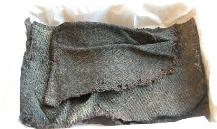
Ylletyg i kypertbindning.