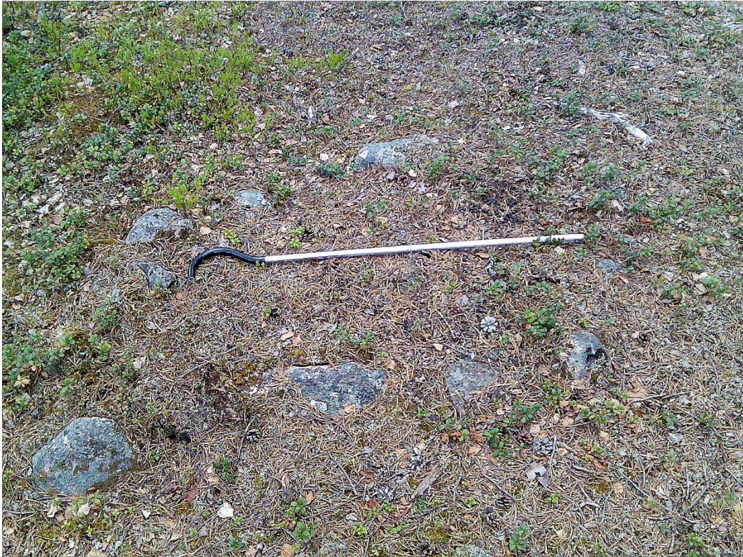
Många härdar är väldigt svåra att se för ett otränat öga.