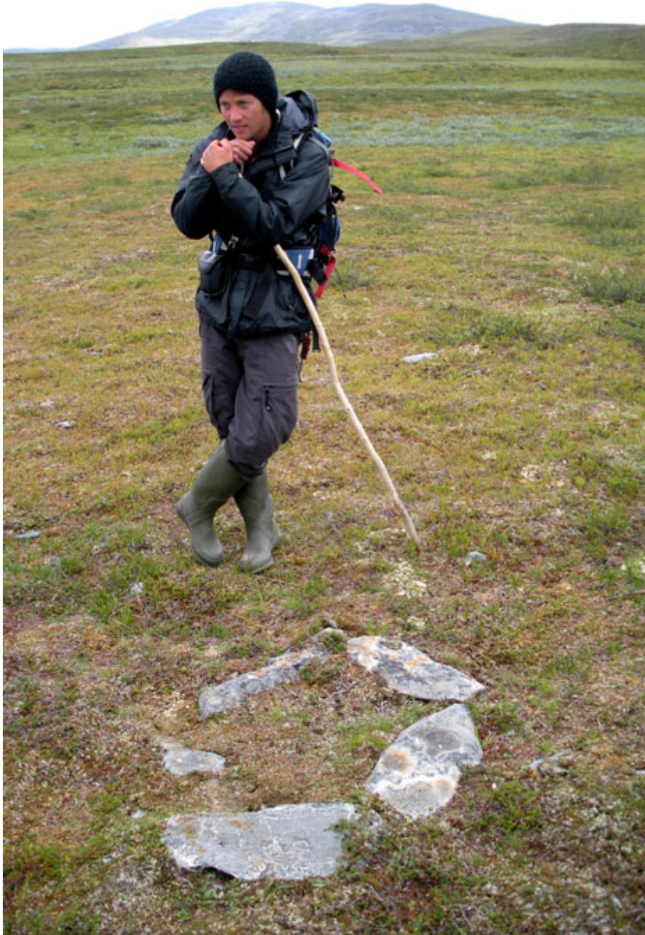
Härd mellan Luspasjaure och Vindelkroken i Sorsele kommun.

Härdar eller eldstäder ligger utomhus eller i en byggnad – de kan ha olika former och avgränsas ibland av stenar. Ofta är härden den enda synliga resten efter en kåta av trä eller tältduk. Härdar påträffas i hela länet, med tyngdpunkt på fjällen.