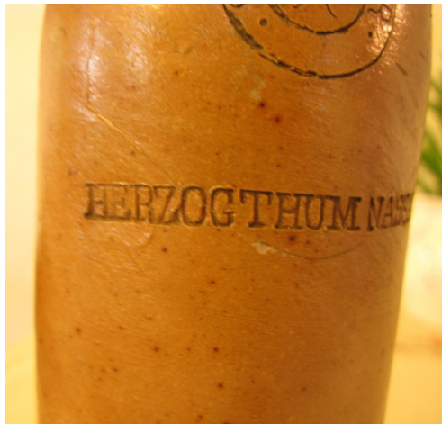
Fragment av krus med texten HERZ samt det krus som fanns vid vårt boende i Österbotten.

Denna typ av krus är tillverkat i Nassauområdet (Hessen i Tyskland). Det var avsett för naturligt mineralvatten från Selters vid Taunusbergen i Hessen. Seltervatten ansågs nyttigt och har gett namn till olika typer av mineralvatten senare.