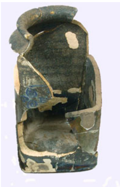
Tobaksburk i fajans från Gammplatsen i Lycksele. 16-1700-tal. Höjd: 15 cm.

Fajans är ett poröst lergods med glasyr, på framsidan ofta ogenomskinlig medan baksidan är genomskinlig. I länet har fajans främst påträffats på Gammplatsen i Lycksele, från 16- och 1700-talen.