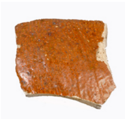
En skärva stengods från Umeå stad. Storlek: 3 cm.

Stengods är ett hårt bränt lergods som upphettats så kraftigt att godset sintrats. I samlingarna finns flera skärvor av sentida stengods från bland andra Gammlplatsen i Lycksele, Åsele kyrkstad samt från undersökningen vid Backens kyrka i Umeå.