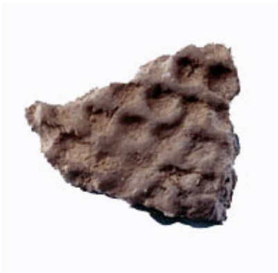
Textilornerad asbestkeramik från Umedalen, Umeå. Daterad till bronsålder.

Redan tidigt kände man till asbestens egenskaper. Genom att blanda in asbest med lera fick man ett lätt, starkt och värmetåligt kärl. Asbestkeramiken förekommer från äldre bronsålder och en bit in i järnålder. Omkring år 0 uppträder asbestgodset, mängden asbest är nu betydligt större – upp till 90%. Det finns teorier om att keramiken har med bronsgjutning att göra medan godset använts som ässja (öppen härd) när man började framställa järn.