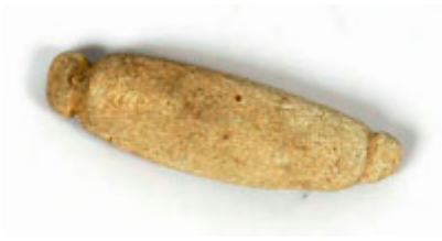
Ett enkelt hänge av sandsten hittades på en stenåldersboplats i Östra Ormsjö, Dorotea kommun. Längd: 5 cm.