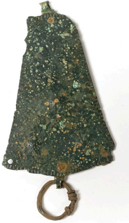
Parallelltrapetsformat hänge av brons med nitar och ring i järn. Hittad i Paulund, Lycksele kommun. Längd: 7 cm.