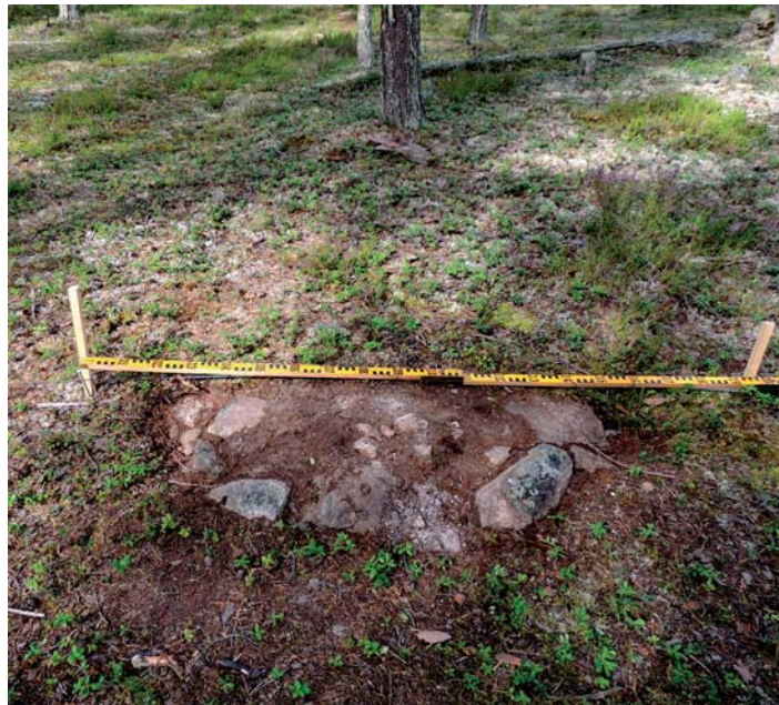
Fig. 3. Härd daterad till 1800-talets slut, Hortlax sn, Piteå. Härden är belägen i ett område som nyttjas som vinterbetesmarker för renar.

Inlandets och fjällens samiska samhällen har stått i fokus för ett flertal arkeologiska studier (jfr Aronsson 1991; Mulk 1994; Storli 1994; Andersen 2002; Hedman 2003; Bergman 2006; Bergman et al. 2008; 2013; Sommerseth 2009). Bosättningsmönster och ekonomiska strategier har tolkats i analogi med historiskt kända förhållanden i Sápmi. På så vis har etniska idiom i hög grad kommit att formeras och fixeras i relation till förmodat icke-samiska kontexter. I vilken grad kan samiska etniska idiom appliceras på förhållanden i Bottenvikens kustområden under yngre järnålder och tidig medeltid? Vilka var incitamenten till kontakter över kulturgränserna och hur strukturerades inter-kulturella