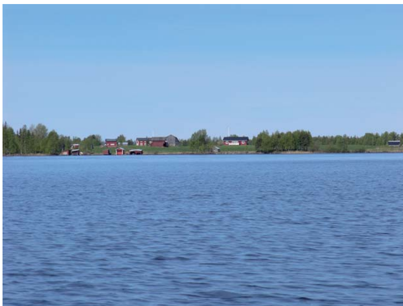
Fig. 5. Vy mot Gråträsk by från O. Sannolikt platsen för de tidigaste träskfiskebodarna.

teras namn på de bönder och byar som fiskade i namngivna träsk (fig. 4). Träskfisket bedrevs på vårvintern fram till midsommartid. Det är främst gädda och abborre som upptas i skattelängderna med angivande av torrsvikt. Hundratals och åter hundratals kilo torrfisk levererades till kronan varje år. Att träskfiskeplatserna anlades i samiskt bosättningsområde framgår bl. a. av den stora mängden samiska lokalnamn och här fanns ett brett kontaktfält mellan kustens och inlandets samhällen. Bönder i Piteå-området idkade t. ex. fiske i sjöar som Gråträsk (fig. 5), Pjesker och Kikkejaure, belägna i 80-90 km från kusten och i ett samiskt landskap med djupa rötter. Av skattelängderna framgår att samer och kustbönder i vissa fall fiskade i samma sjöar, vilket belyser träskfiskets betydelse som arena för täta och nära inter-kulturella kontakter. Den samiska offerplatsen vid Tjautjer, ca. 2 km SV om Gråträsk, med sitt