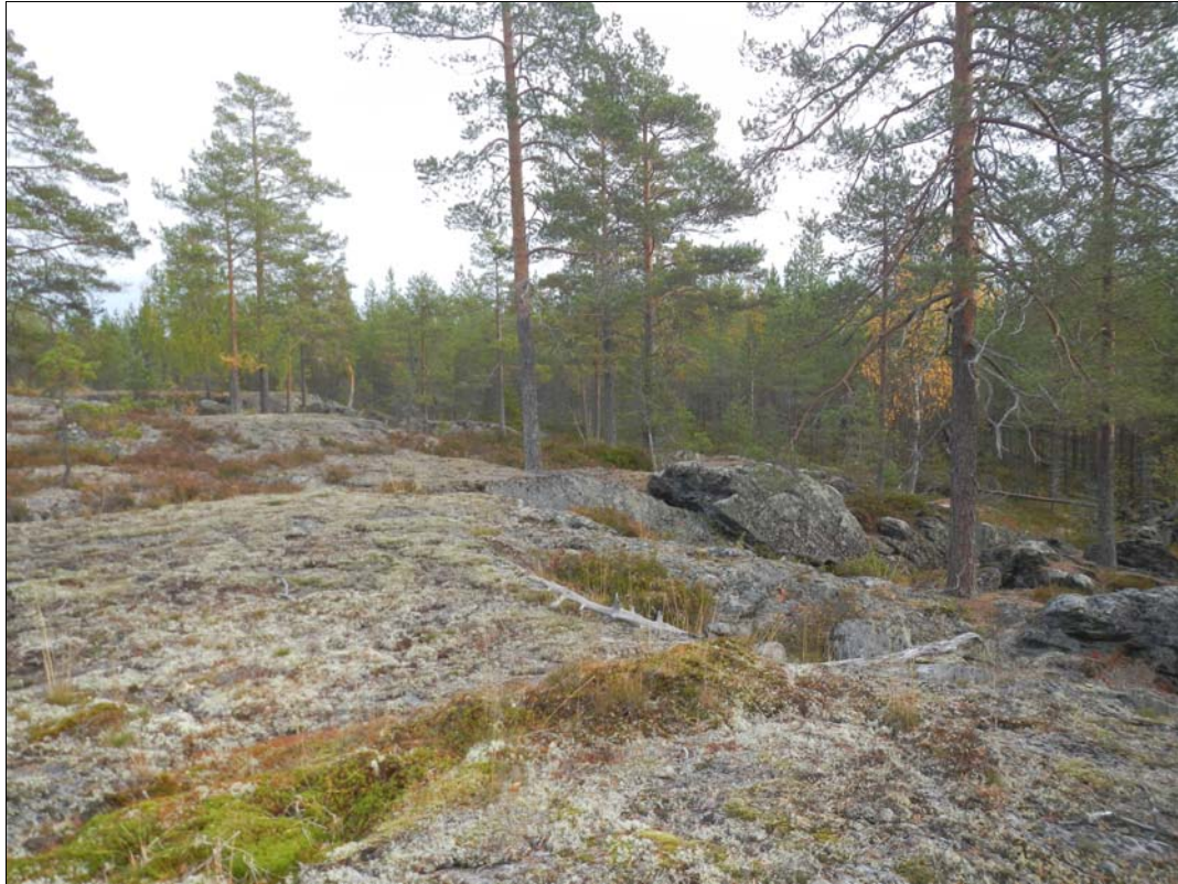
Fig. 2. VBM DB 326:2. Miljöbild över området för den planerade bergtäkten.