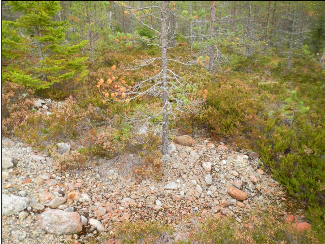
Fig. 3. VBM_DB 326:3. Sentida störning i markskiktet.