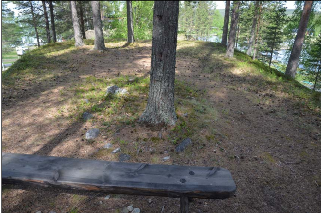
Fig. 2. VBM DB 373:1. Den möjliga graven syns som en oval stenring med ett träd i mitten. Foto från SO.

Undersökningsområdet ligger i Umeälvens dalgång vid byn Granö i Vindelns kommun. På östra sidan av älven består marken främst av öppen odlingsmark och på västra sidan är främst skogsmark med inslag av mindre öppna odlingsytor. Undersökningsobjektet är beläget på västra sidan av älven, på en grusås som löper i NV-SÖ-lig riktning parallellt med älven. På grusåsen är även en campingplats belägen.