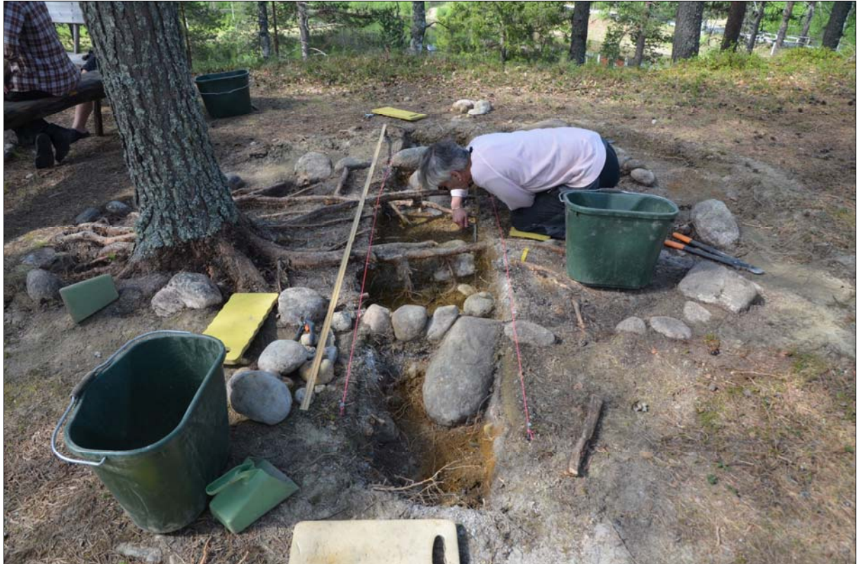
Fig. 3. VBM DB 373:12. Ett schakt lades genom lämningen i NO-SV-lig riktning som grävdes till ca 20 cm djup.