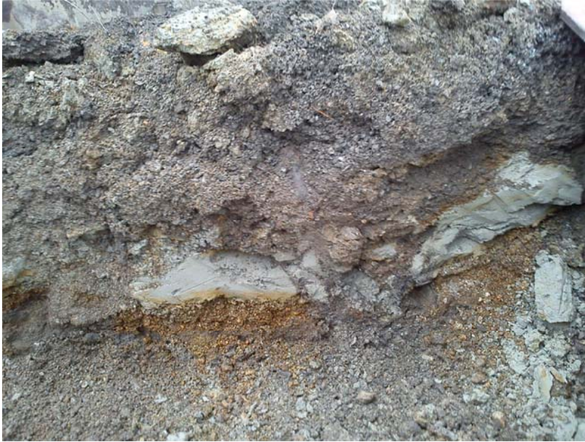
Figur 3: Profil i schakt B mot V