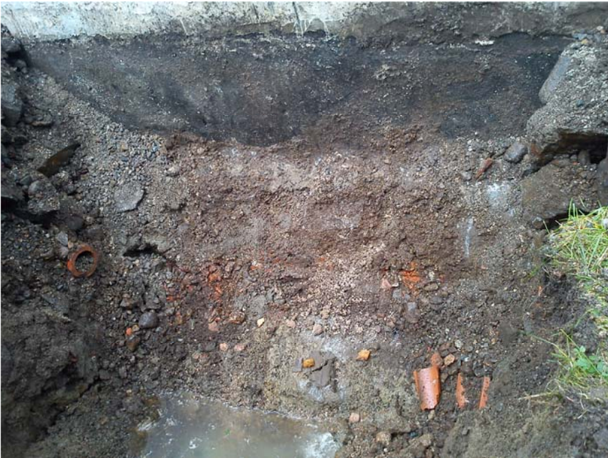
Figur 1: Profil i schakt A mot S