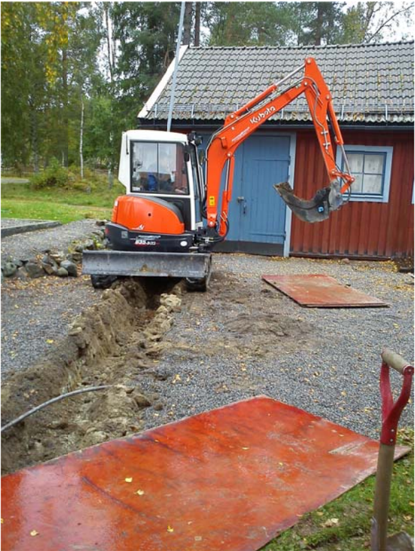
Figur 2: Schakt B mot N