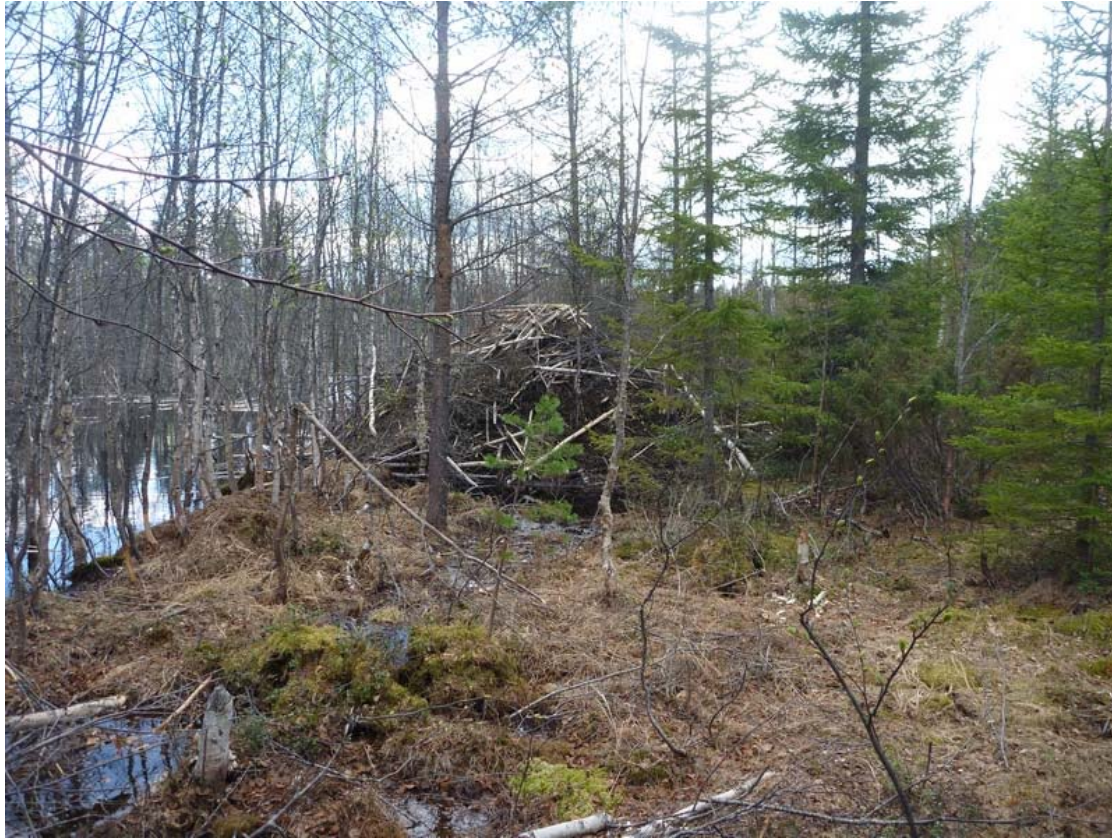
Fig.1. Bäverhydda vid bäck öster om Stormossaberget.