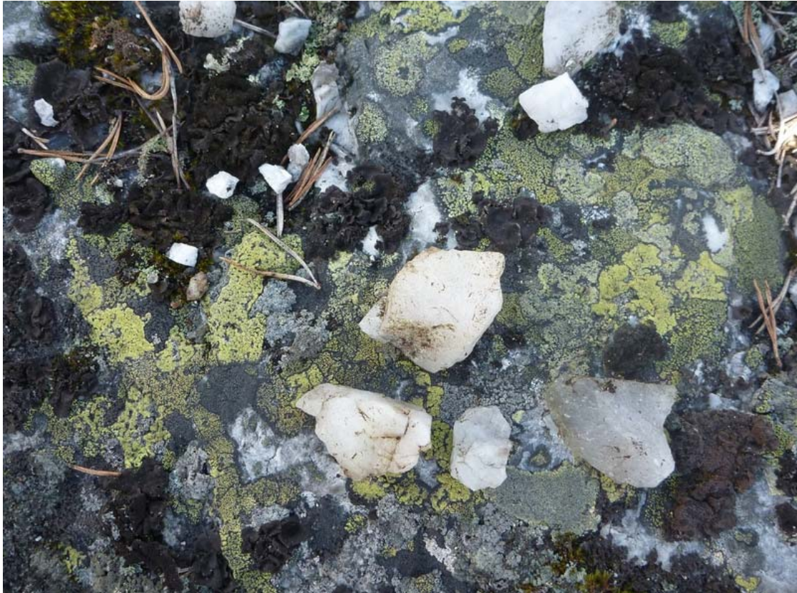
Fig.3. Kvartsfragment vid lokal Vbm 4 på Abborrträskberget.