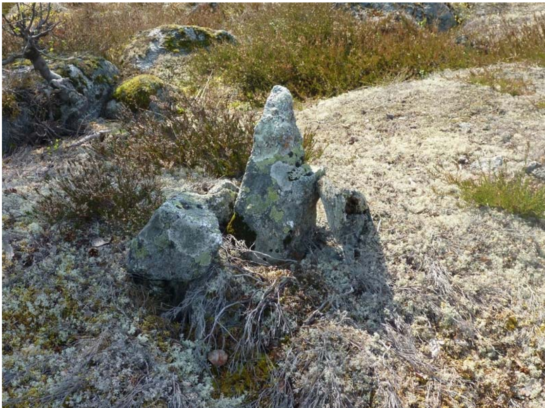
Fig.4. Rest sten, troligen en gammal rågångsmarkering. Lokal Vbm 8.