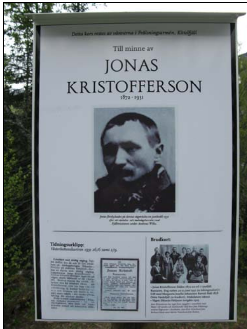
Fig. 3. Skylt vid minnesmärket.

strandbrinken (se fig. 1). Dessutom finns ett minnesmärke (se fig. 3) över en cykelolycka vid vägen i områdets västra del i backen ner mot sjön Borkan (RAÄ nr Vilhelmina 1085:1).