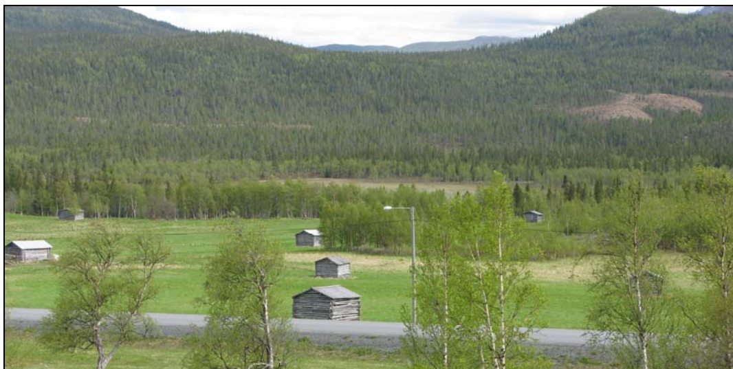
Fig. 2. Vy över ladlandskap inom riksintresseområdet.

Undersökningsområdet var sammanlagt ca 270 ha stort. Hela området ligger i söder och väster om byn, i huvudsak mellan sjön och ån och vägen. Marken inom undersökningsområdet består till stora delar av igenväxande odlingslandskap och i övrigt av skogsmark. Mellan detaljplaneområdena ligger öppet odlingslandskap som även utgör en kulturmiljö av riksintresse (se fig. 2).