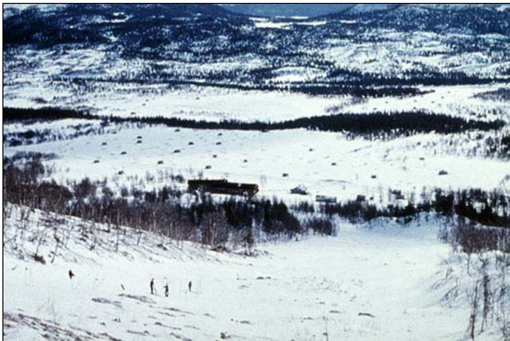
Fig. 4. Fotografi från 1960 taget från liften där det stora antalet lador och det öppna landskapet syns.