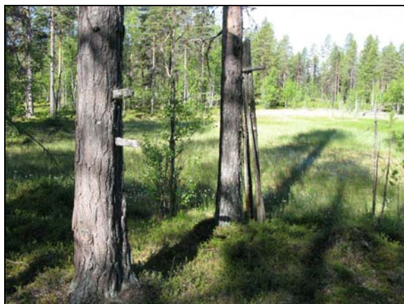
Myrhässja bestående av två tallar med inslagna pinnar.