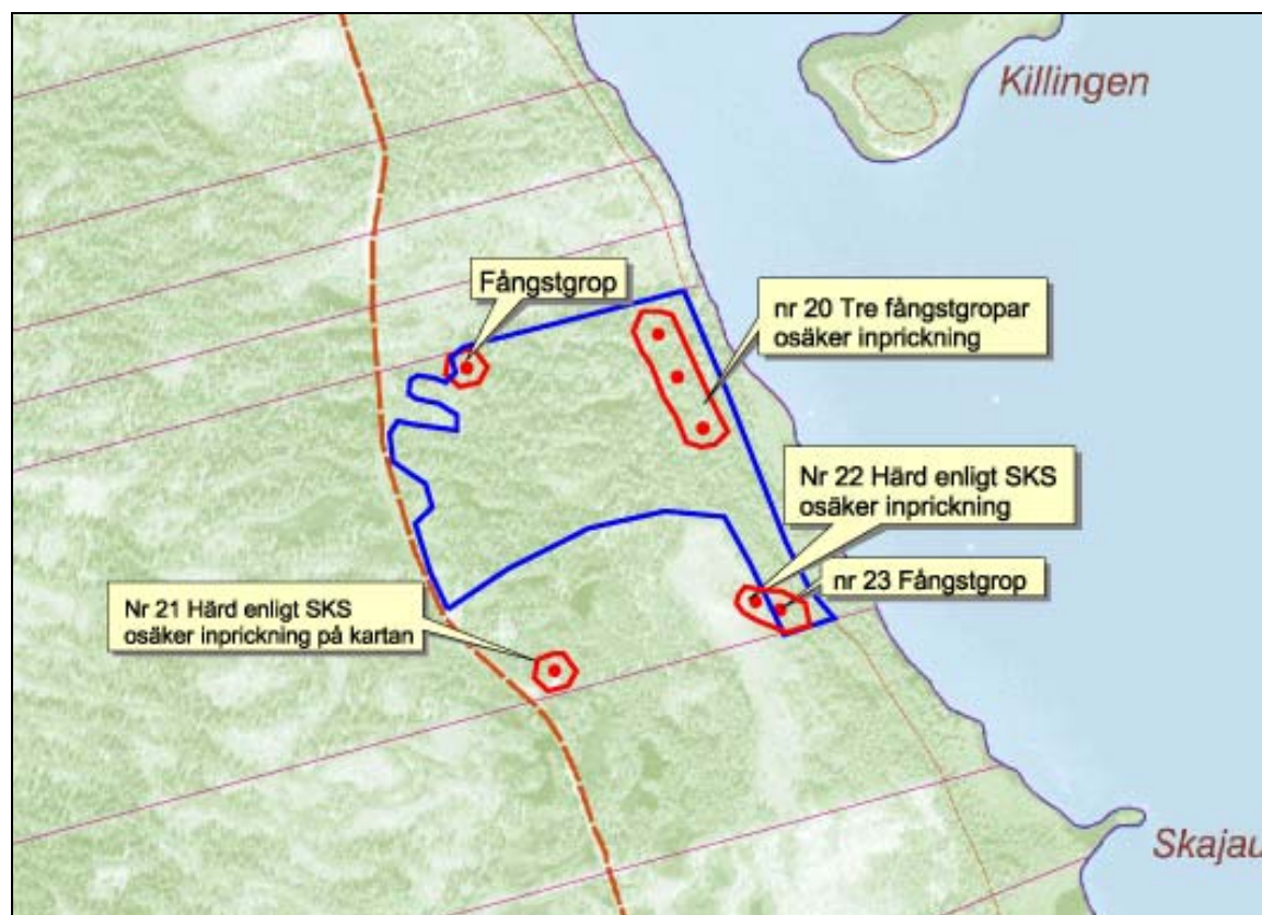
Karta med uppgifter om fornlämningar vilken användes som underlag vid besiktningen.

Med anledning av uppgifter om ej registrerade fornlämningar på fastigheten Saxnäs 2:51 har Västerbottens Museum AB genomfört en arkeologisk besiktning av området enligt beslut från Länsstyrelsen kulturmiljö (Lst 431-12498-2008). Anledningen till besiktningen är att fångstgropar inom avverkningsområdet påträffats inom projektet Skog & Historia vilka ej granskats av arkeolog och att det kan finnas ytterligare lämningar enligt uppgifter från Skogsstyrelsen.