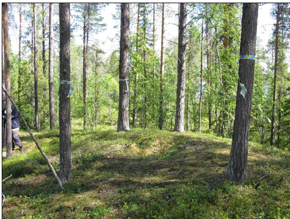
Kokgrop markerad med fornlämningsband.

Nr 23: Kokgrop, rund, 1m i diam och 0,2 m dj. Kring kanten är en vall, 1m br och 0,1 m h. Vid provstick med jordsond framkom lite blekjord i botten samt kol och sot under. Med sonden kändes även sten och en skärvsten plockades upp. Koordinat: 7259107 / 1577653