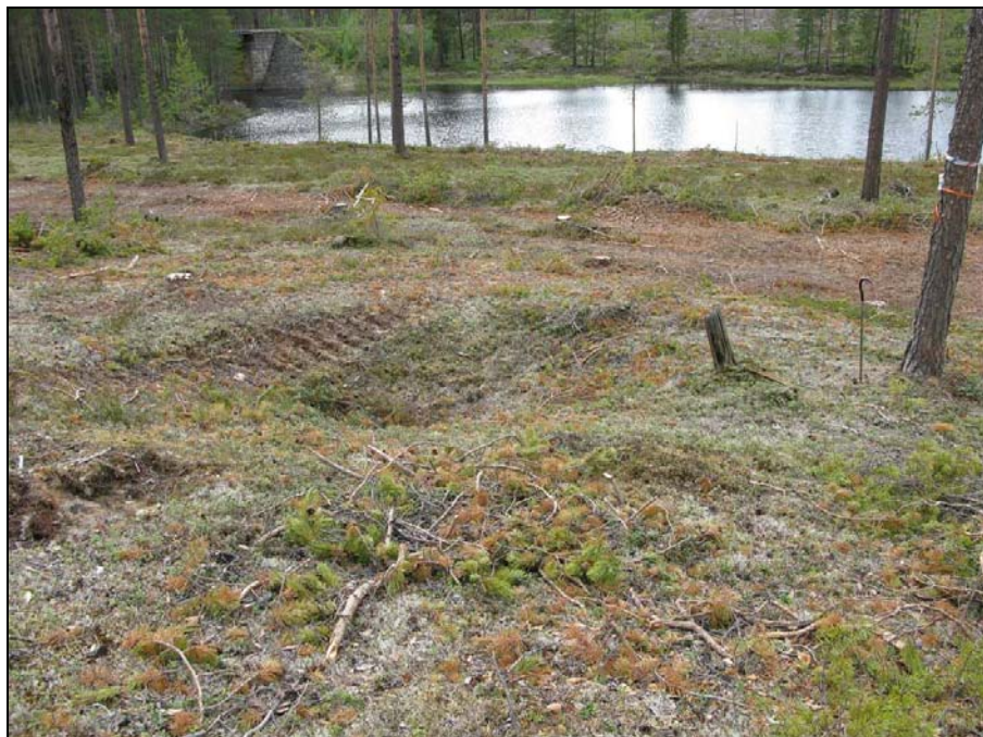
RAÄ 123:3 fotograferad från NÖ, en körskada syns tydligt i gropen.