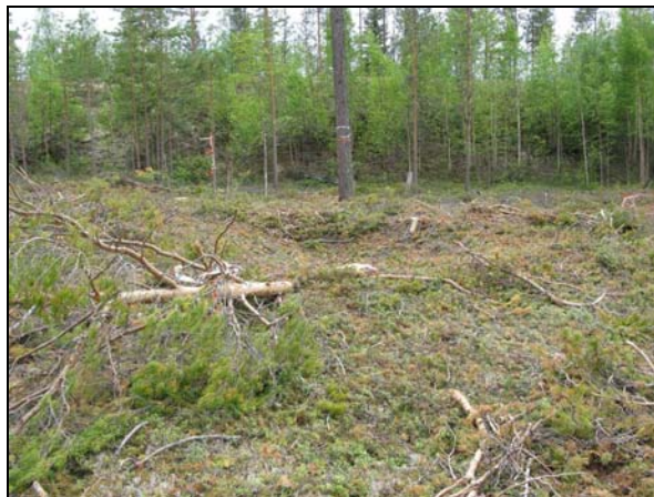
RAÄ 123:2 fotograferad från SÖ, gropen är svår att se pga ris. Samma fångstgrop från NÖ.

RAÄ 123:3 Fångstgrop, oval, 3,5 x 2,5 m (N-S) och 0,6 m dj. Kring kanten är ställvis en vall, 1,5 - 2 m br och 0,1 - 0,3 m h. Vid provstick framkommer blekjord.