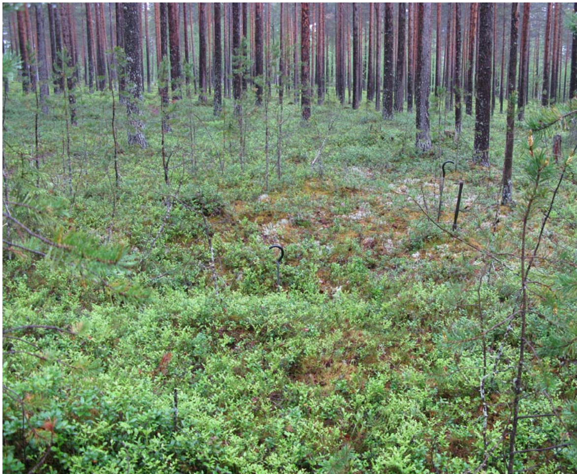
Fig. 1. Fångstgrop som påträffades strax utanför områdets västra kant.

En arkeologisk utredning har genomförts med anledning av detaljplanearbete på fastigheten Nydala 1:1, Lycksele kommun. Vid utredningen påträffades inga forn- eller kulturlämningar inom utredningsområdet. Emellertid påträffades en fångstgrop ca 14 meter väster om utredningsområdet (fig. 1). Fångstgropen bedöms vara en fast fornlämning. De östra delarna av utredningsområdet var storblockigt och delvis sankt. I ett litet område av den västra delen hade marken mer inslag av sand och det var i denna del som fångstgropen påträffades. Fångstgropens läge passar in i ett mönster av enstaka fångstgropar samt fångstgropssystem på älvens västra sida. Fångstgropen markerades med fornlämningsband i omgivande träd.