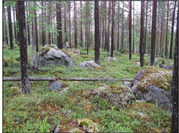
samt det östra, steniga området.