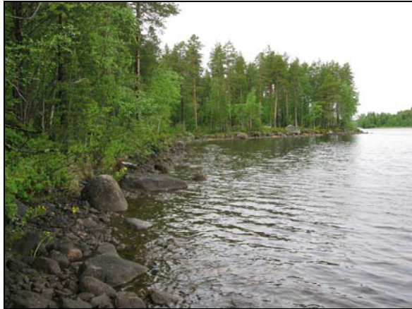
Fig. 2. Miljöbilder över den steniga stranden