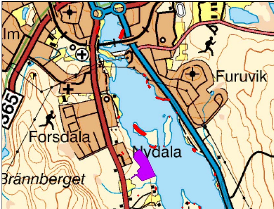
Vägkartan över utredningsområdet med utredningsområdet markerat med lila, röda markeringar är fornlämningar.