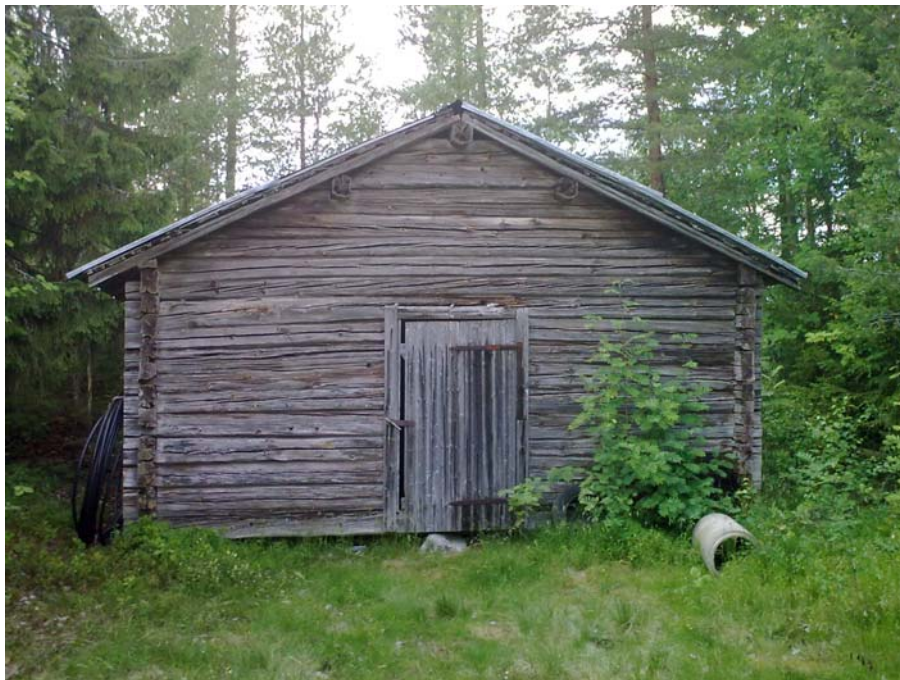
Slätterlada i områdets NÖ del.