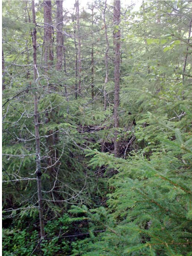
Inne bland träden står en äldre slåttermaskin.