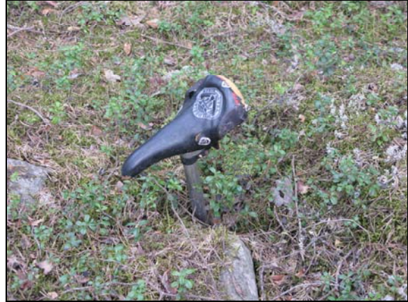
Spår av motionsaktivitet.