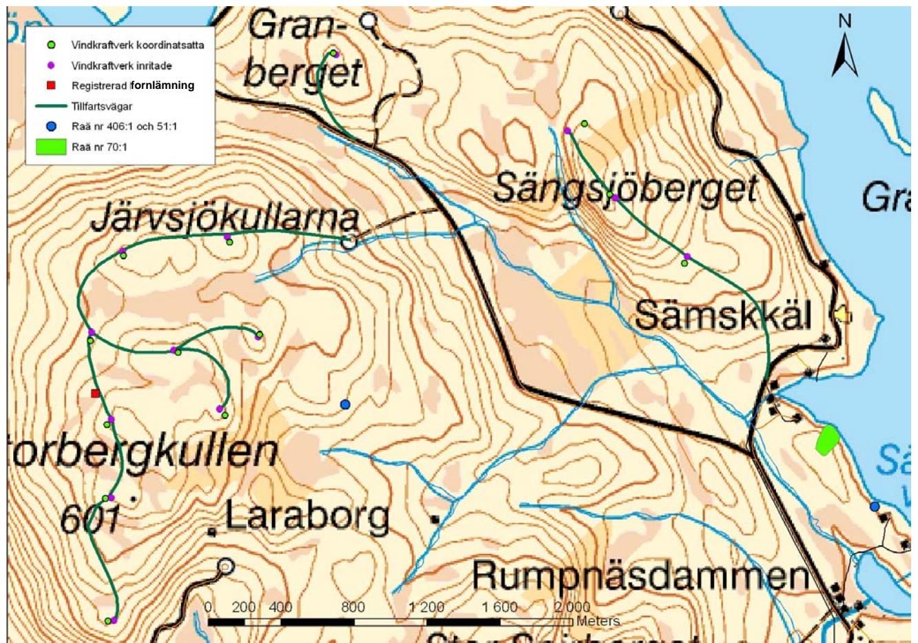
Karta över tillfartsvägar och platser för vindkraftverk på västra sidan Sängsjö.