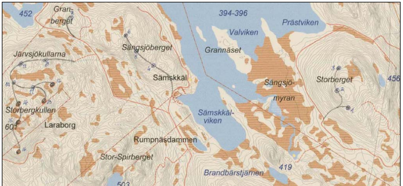
Karta med tillfartsvägar och platser för vindkraftverk inritade tillhandahållen av Amonte AB.