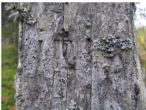
Del av ristning i torrall.

Fornlämningen är registrerat i Riksantikvarieämbetets registreringsprogram Fält-GIS och inmätt med GPS med 7 meters noggrannhet och kommer att inrapporteras till Riksantikvarieämbetet.