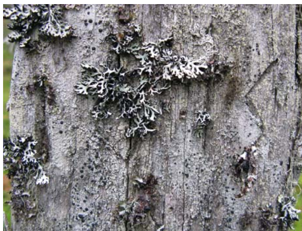
Del av ristning i torrall..