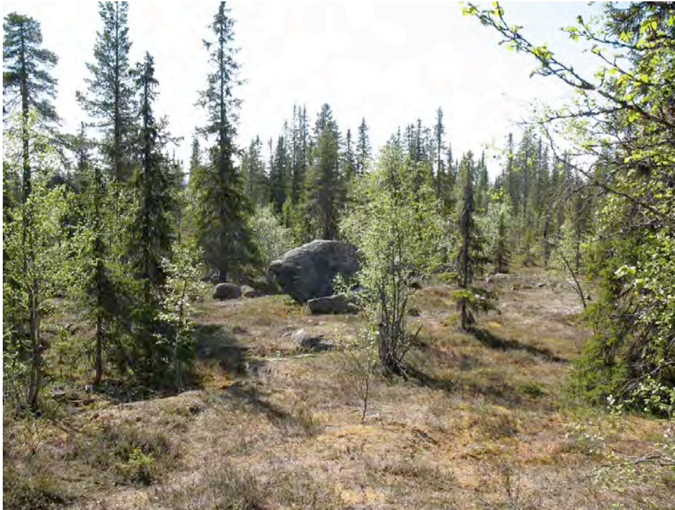
Täktområdets nordvästra del, från norr