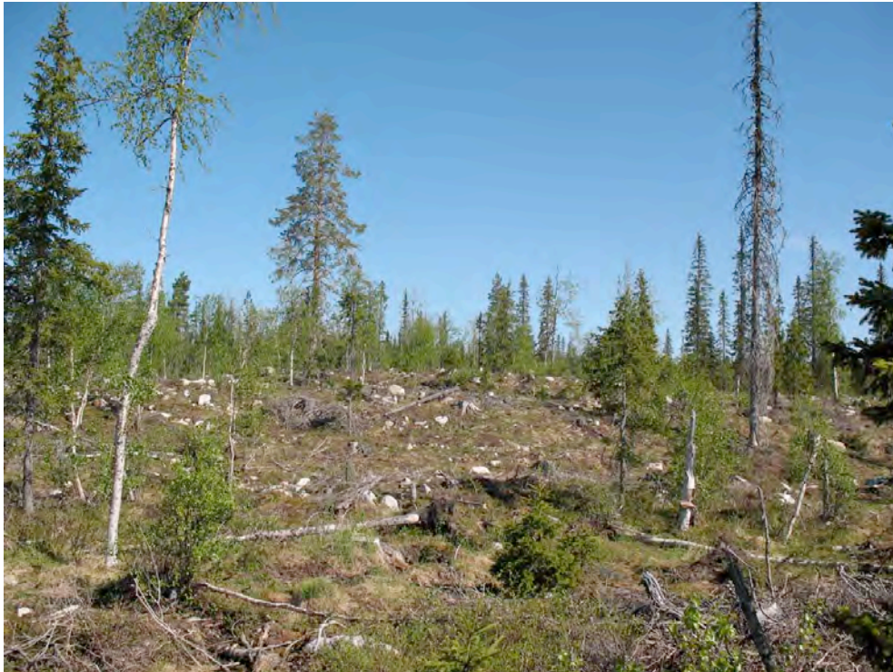
Områdets sydöstra del, inom ett kalhygge

Den aktuella platsen ligger vid Grundsjöbergets sydöstra sluttning i svagt kuperad terräng. Områdets nordvästra del är skogsbevuxen och uppvisar en hel del berg i dagen medan den sydöstra delen ligger inom ett nyplöjt, stenbemängt kalhygge. Även några mindre fuktstråk finns inom området. Inga kända fornlämnningar finns sedan tidigare registrerade i området.