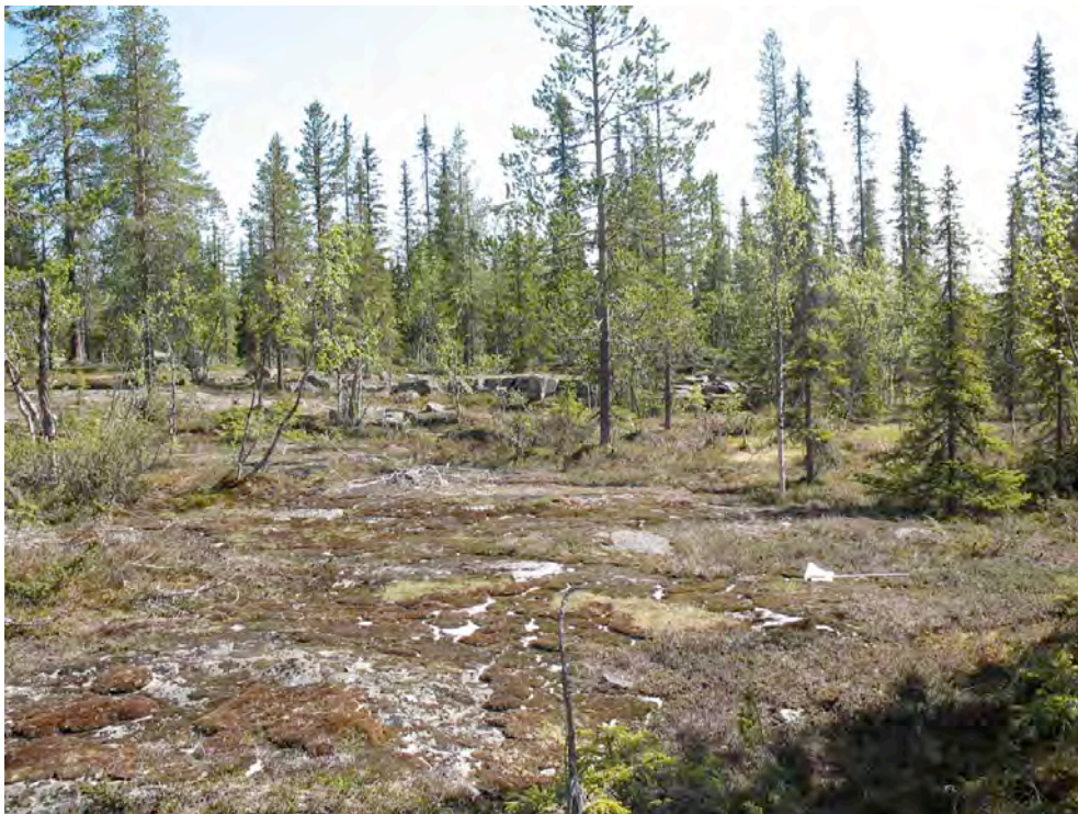
Brytningsområdets södra del, sett från väster