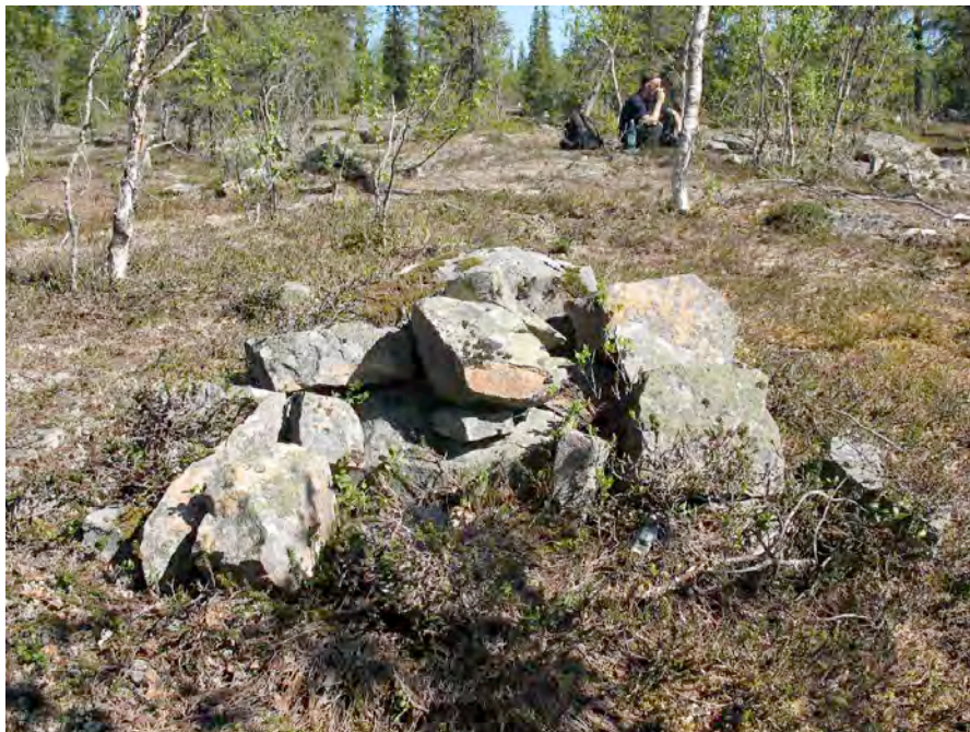
Den andra stenpackningen

Den andra stenpackningen uppvisar en fyrkantig form, ca 1,5 x 1,5 meter stor och ca 0,4 meter hög och har samma dimension på stenarna i fyllningen som den föregående packningen. Denna lämning ligger placerad på koordinat: X 7187749, Y 1555322. Inga fynd kunde noteras mellan stenarna i någon av konstruktionerna och deras funktion är därför okänd. Med tanke på att inte någon av stenpackningarna var övertorvade tolkas lämningarna som sentida.