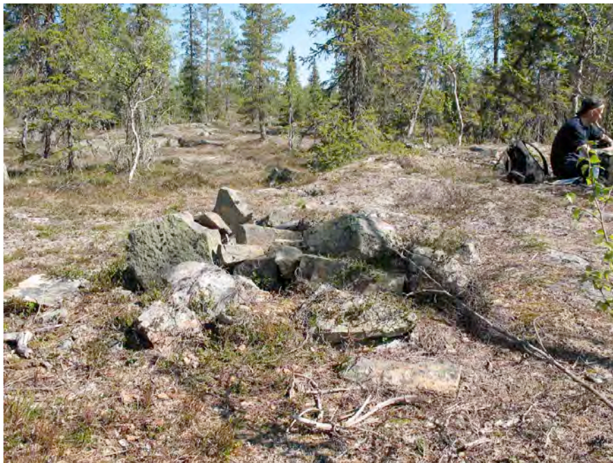
Stenpackning, delvis utrasad

Den ena stenpackningen är ca 1 x 1 meter i diameter med en oval form (stenarna delvis utrasade) och med en höjd av ca 0,4 meter. De stenar som packningen är uppbyggd av uppvisar en storlek mellan 0,2-0,5 meter. Packningen ligger placerad på koordinat: X 7187771, Y 1555310.