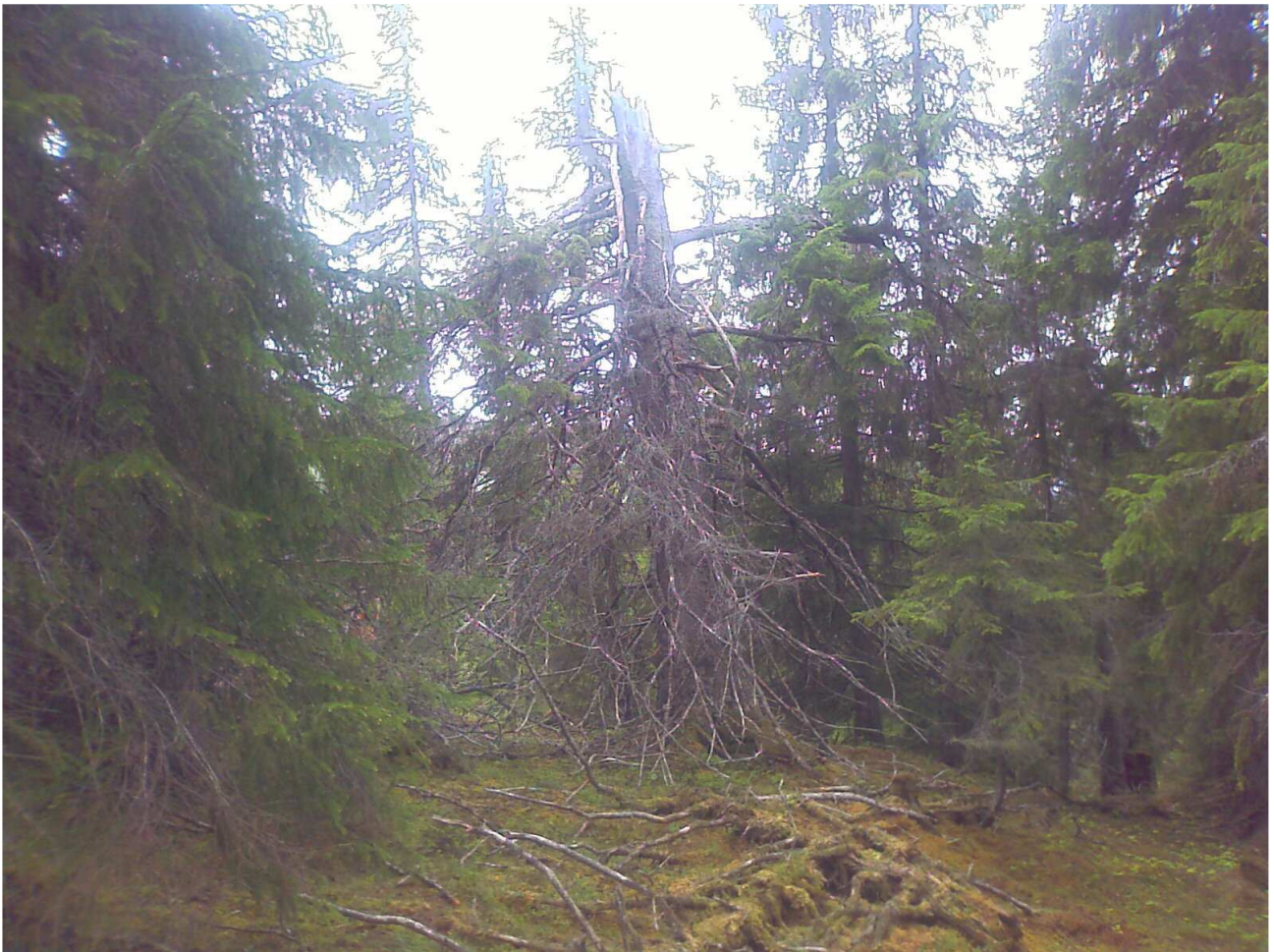
Fotografi från området.

Mikael Jakobsson Skogsmuseet i Lycksele AB Juni 2008