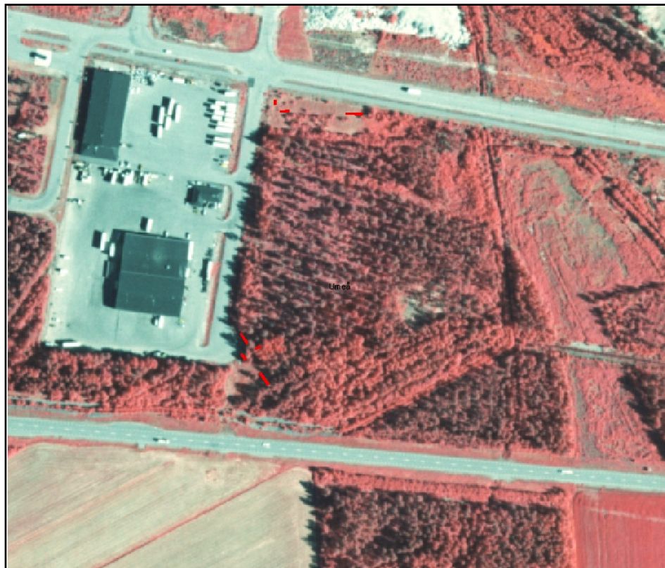
Fig. 2. Översikt över de västliga schakten 1, 2, 13, 14, 15, 16,