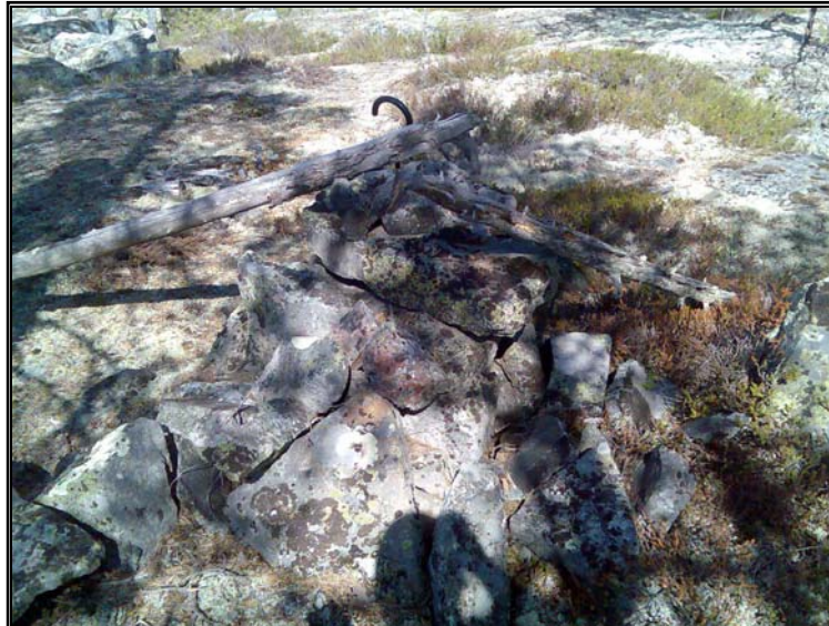
Foto av rösningen från söder.

Rösningar kan ha fungerat som riktmärken, men kan ha flera funktioner som t ex topprösen eller markeringar för gömmor. Rösningen har bedömts som en kulturhistorisk lämning.