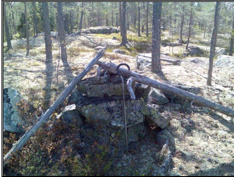
Foto av rösningen från norr.