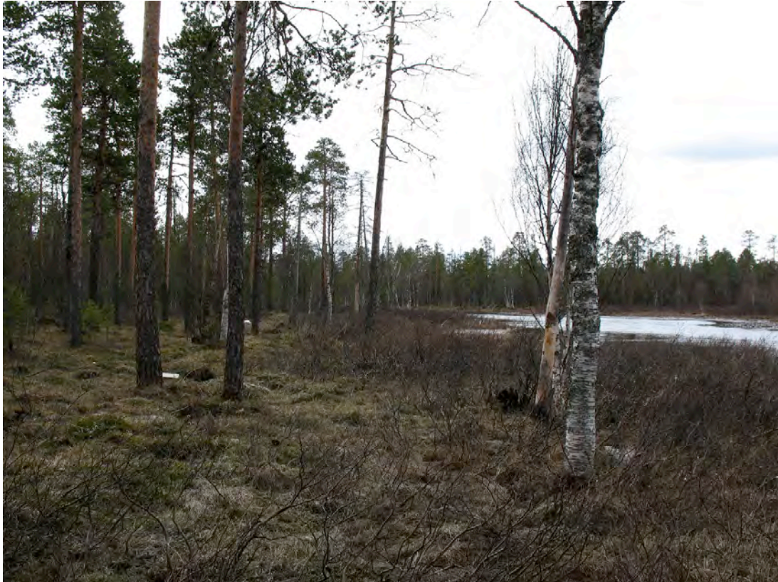
Undersökningsområdets nordvästra del