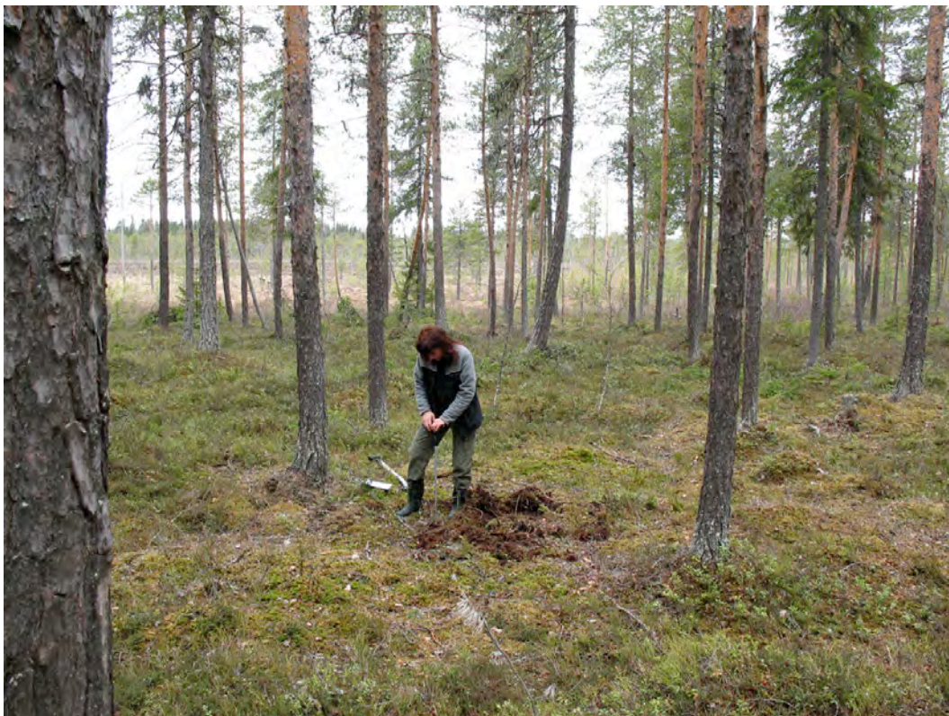
Undersökningsområdets mellersta del