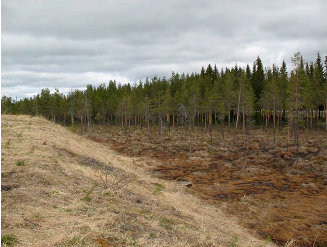
Undersökningsområdets södra del