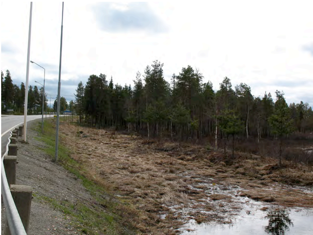
Undersökningsområdets norra del