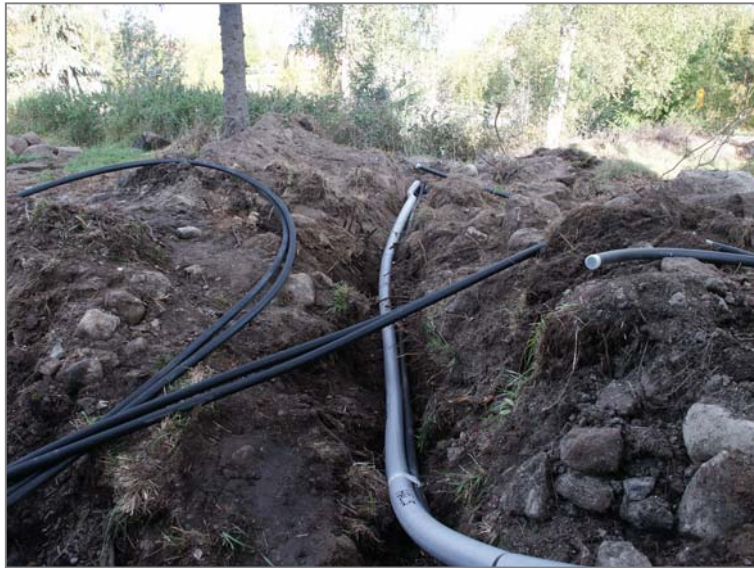
Fig 6. Schakt F mot NV