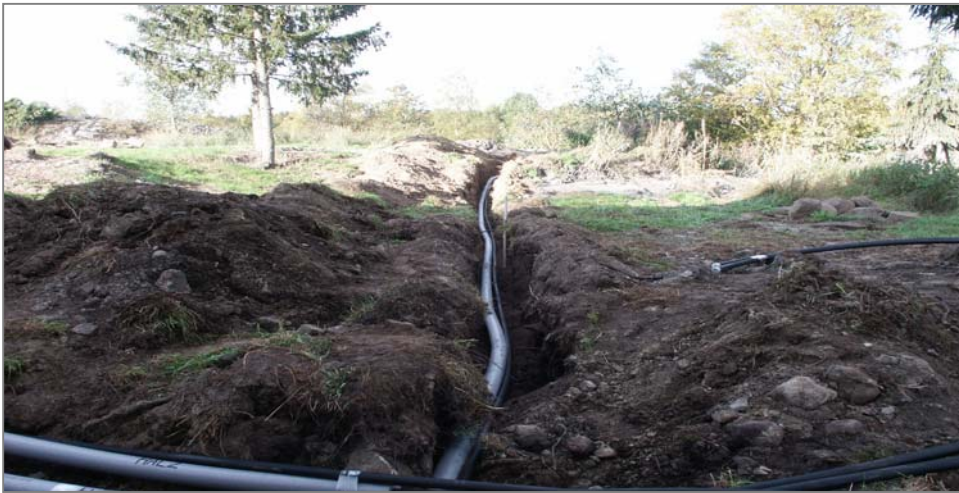
Fig 4. Schakt D mot VNV