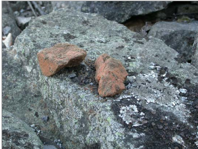
Fig 8. Tegel schakt A