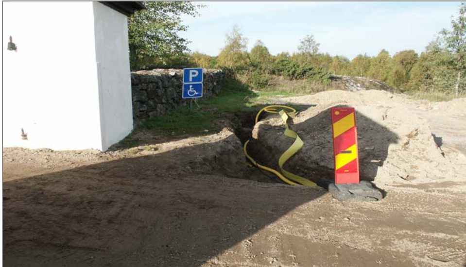
Fig 3. Schakt C mot V