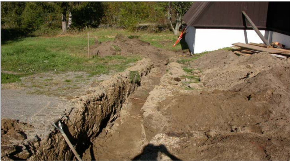
Fig 2. Schakt B mot N