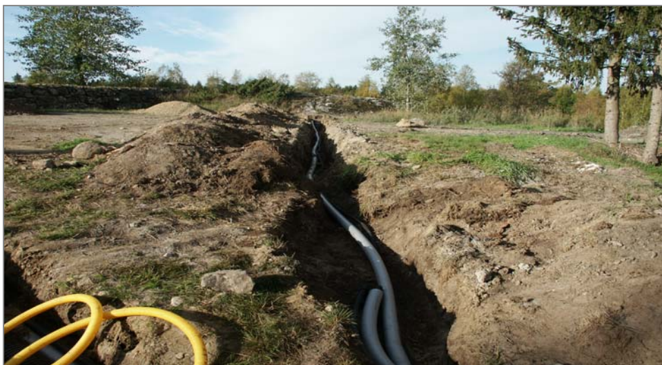
Fig 5. Schakt E mot V