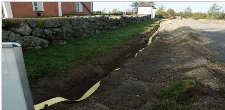
Fig 7. Schakt G mot V