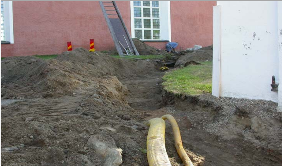
Fig 1. Schakt A mot S