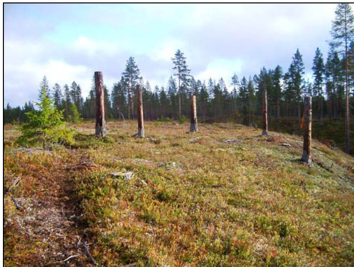
Område vid Lillele, Degerfors sn med väldigt många högstubbar som dels markerar vägar men även fångstgropar och kolbottnar.