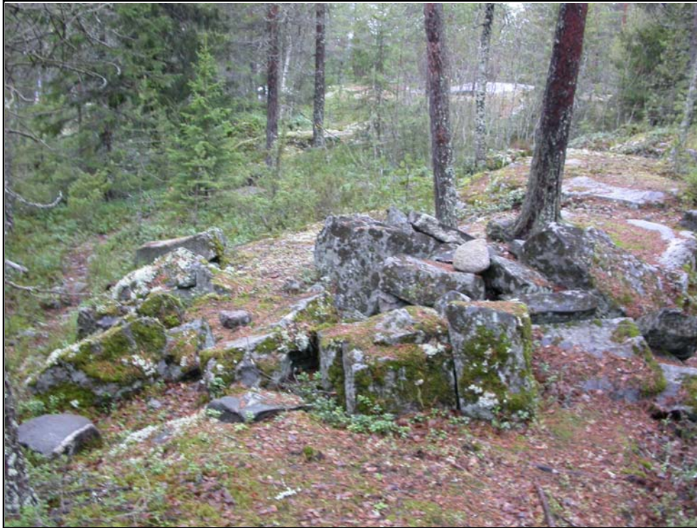
Fig..2. Stentäkten, koncentration av bearbetade stenar. Foto mot V.