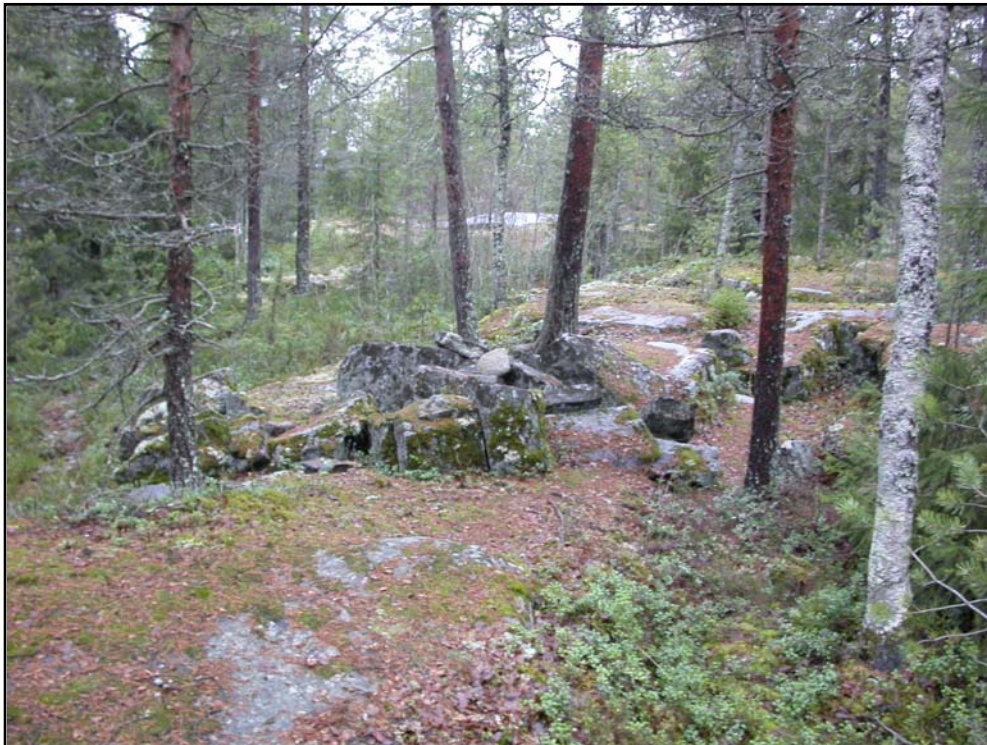
Fig. 1. Stentäkten. Foto mot V.

Syftet med den arkeologiska utredningen var att inventera området och undersöka om oregistrerade forn- och kulturlämningar kom att beröras av den planerade exploateringsverksamheten i området.