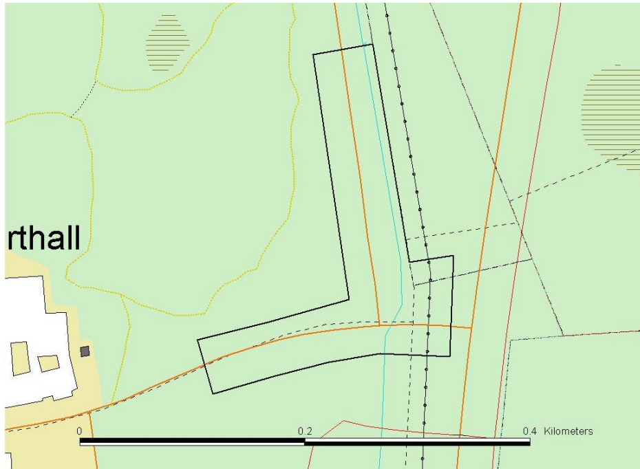
Fig. 1. Utredningsområdet Lilljansvägen/Gösta Skoglunds väg.