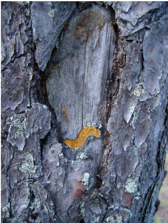
Fotografi av träd med bläcka i vilken ett stukmärke syns. Det S-formade stukmärket är markerat med orange färg.

Fotografier: Digitala bilder. Förvaras på Västerbottens museum.