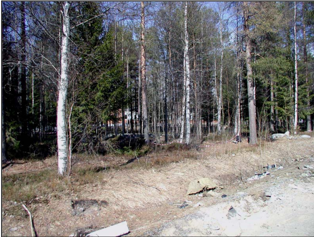
Fig. 2. Utredningsområdet. I förgrunden ser man området som senare kom att avbanas, I bakgrunden syns stängslet och bakom det röse nr. 2. Foto mot N.