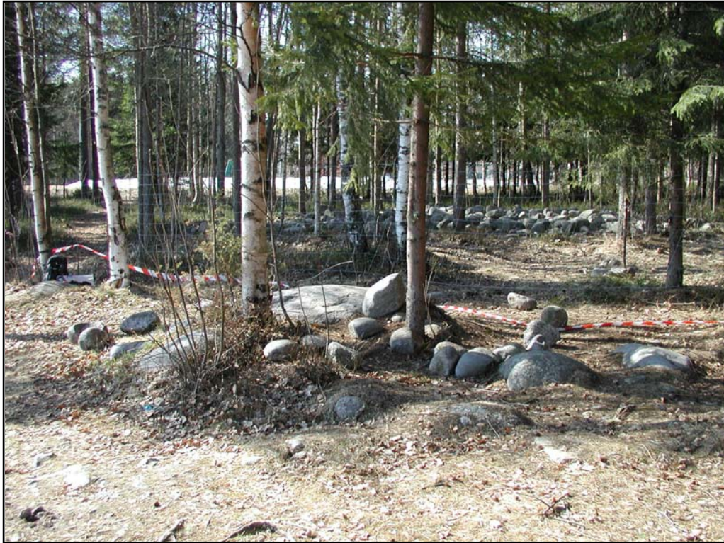
Fig. 4. Stensamling runt tre jordfasta block. I bakgrunden röse nr. 2. Foto mot NV.