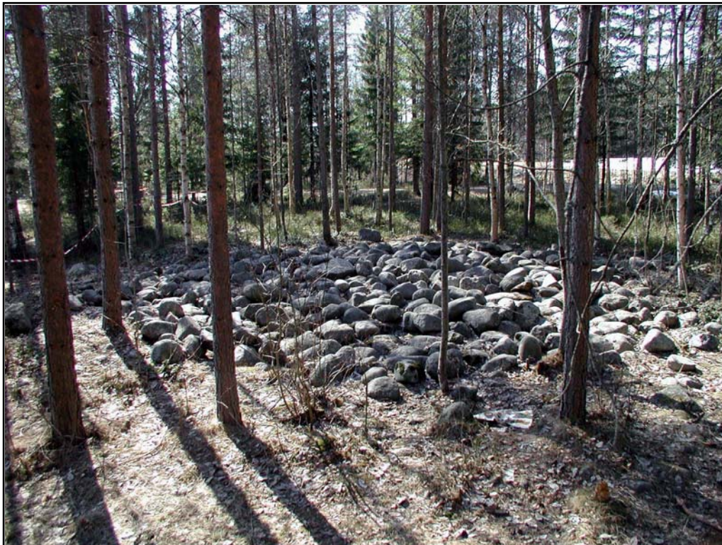
Fig.3. Röse nr.2. Foto mot V.