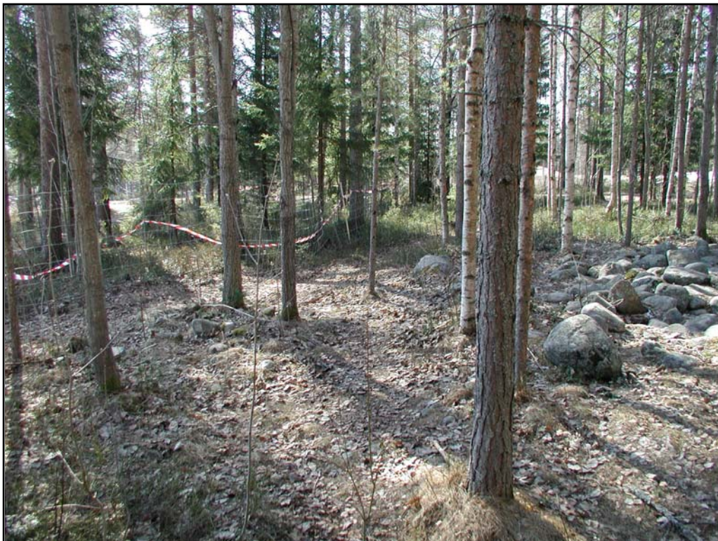
Fig. 5. Stensamling belägen ca 2 m S om röse nr. 2. Foto mot SV.