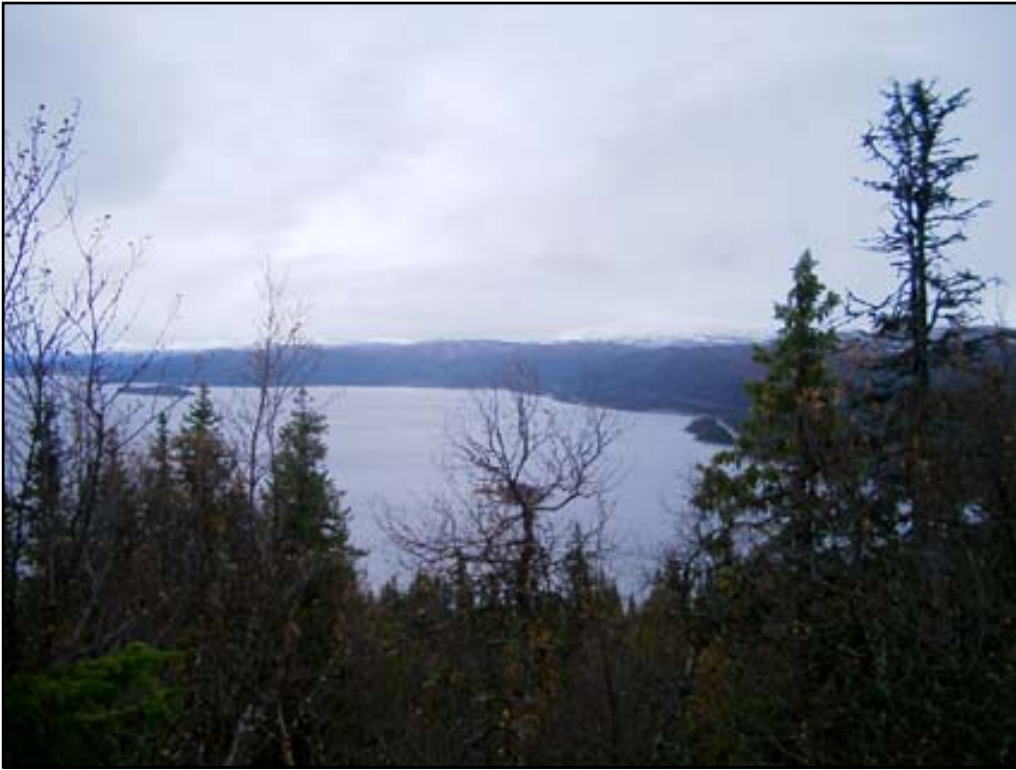
Fig 3. Vy från utredningsområdet vid Stornäs över Kultsjön. Vilhelmina kommun. Foto mot SÖ.