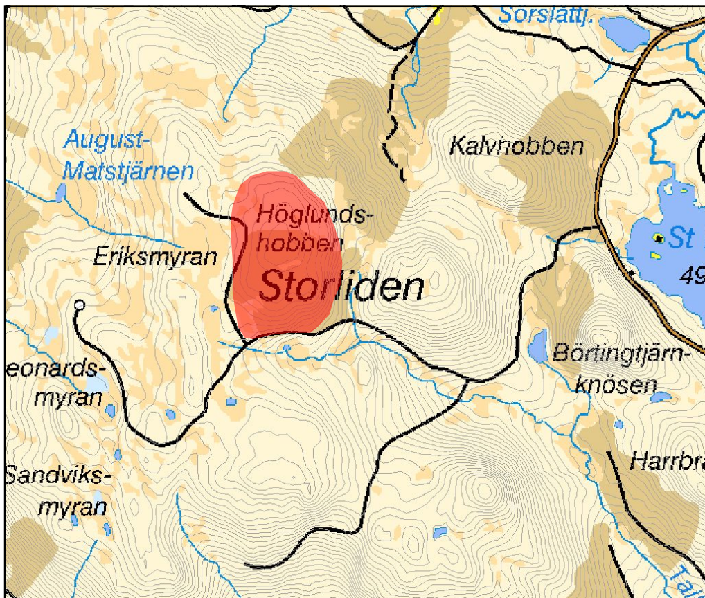
Fig 2. Utredningsområdet (markerat med rött) vid Storliden, Sorsele kommun.