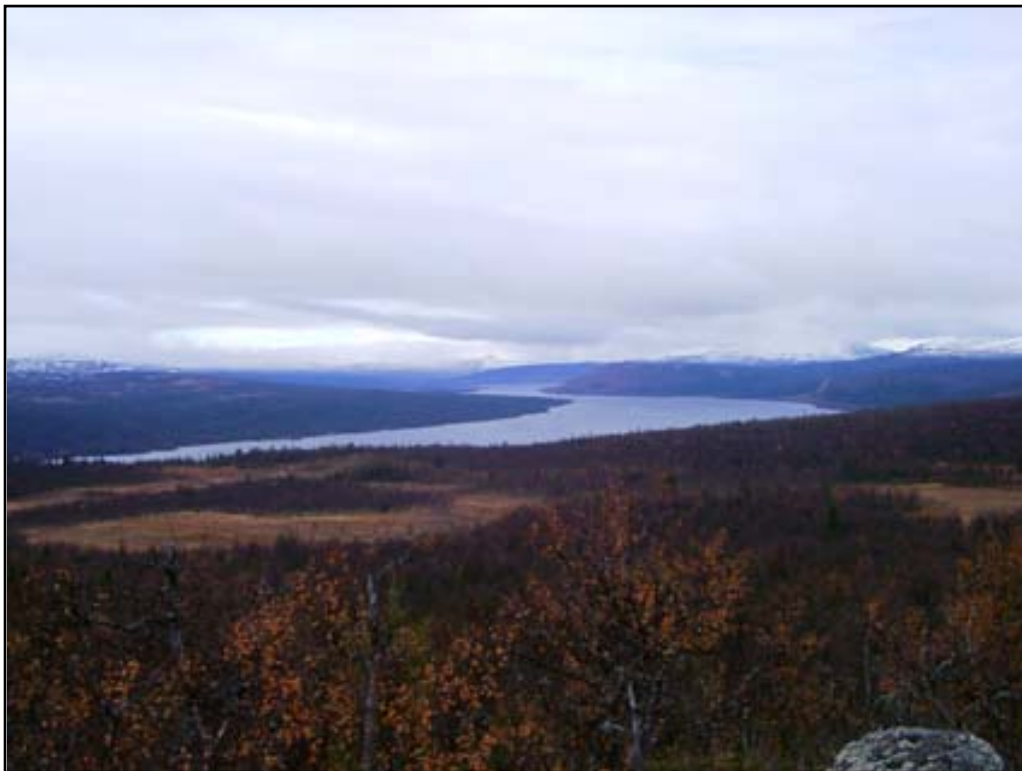
Fig 4. Vy från utredningsområdet vid Stornäs över Kultsjön. Vilhelmina kommun. Foto mot V.