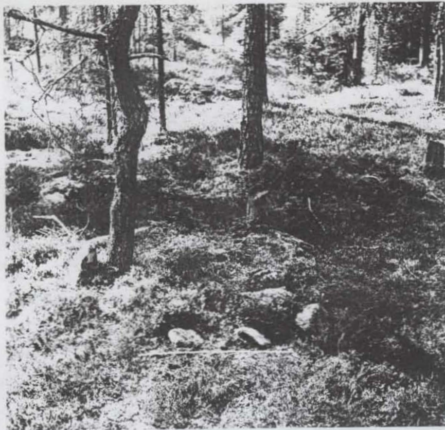
Nordmaling sn. Fornl. nr 51:4 Tumstocken 1 m Foto mot VNV. A. Huggert 23/7 1976. Neg: A 257:4